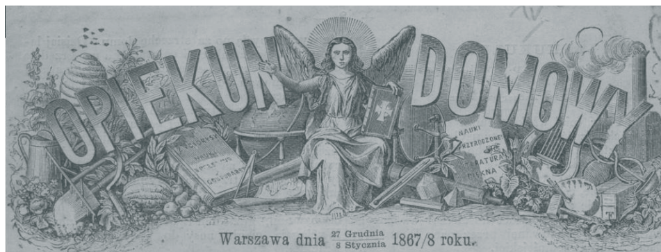
Rysunek 5. Winieta „Opiekuna Domowego” z przełomu lat 1867/8