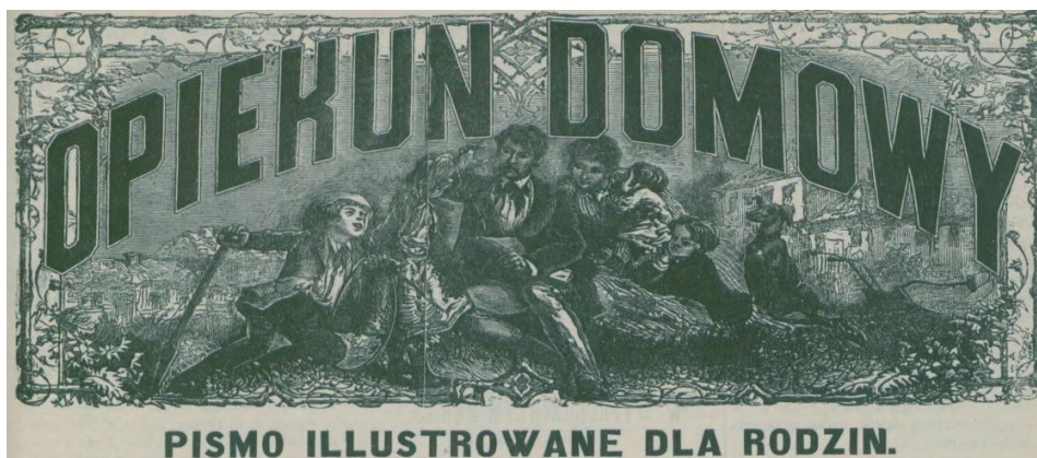
Rysunek 8. Winieta „Opiekuna Domowego” z 1876 r.