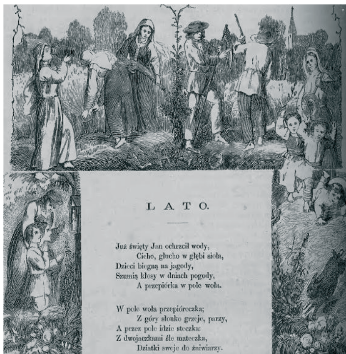
Rysunek 1. Grafika ilustrująca wiersz „Lato”, OD 1865, nr 29, s. 236 (fragment).