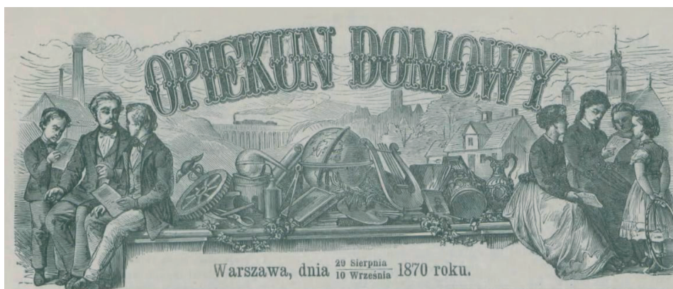
Rysunek 7. Winieta „Opiekuna Domowego” z 1870 r.