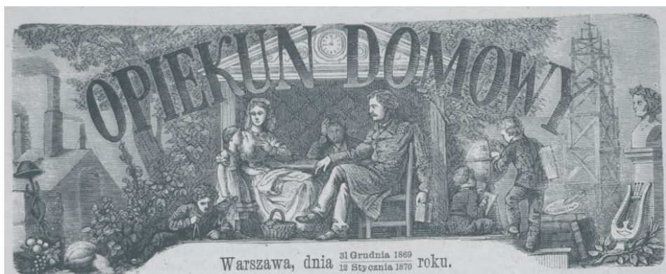
Rysunek 6. Winieta „Opiekuna Domowego” z przełomu roczników 1869/1870