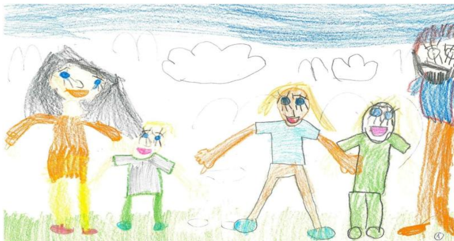
Rysunek 1. Praca plastyczna dziecka (dziewczynki), lat 6.

Rysunek rodziny wskazuje również na typ emocjonalności dziecka, określanej jako sensoryczny lub racjonalny. Rysunek sensoryczny charakteryzuje się witalnością, spontanicznością, co znajduje swój wyraz w rysowaniu linii są zaokrąglanych oraz prezentowaniu rodziny w sposób dynamiczny w trakcie wykonywania określonych aktywności. Z kolei na rysunku racjonalnym znajdują się linie proste, postacie są kanciaste i geometryczne, widać dużą dbałość o szczegóły i porządek na rysunku (Braun-Gałkowska, 1985).