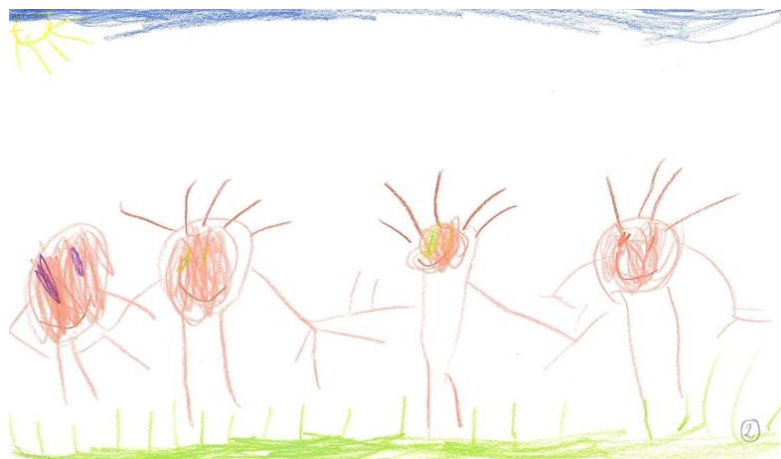
Rysunek 2. Praca plastyczna dziecka (dziewczynki), lat 6.

Na rysunku 1 można odnaleźć wymienione wyżej dominujące cechy. Rysunek wykonano z wyraźnym odniesieniem do kanonu obowiązującego w tego typu obrazowaniu. Kompozycja jest spójna, rozmieszczona pomiędzy dwoma układami horyzontalnymi określającymi przestrzeń ziemi i nieba. Występujące na nim postaci usytuowane są rytmicznie i szeregowo. Jest to zestawienie układów horyzontalnych i wertykalnych. Narysowane osoby są związane z podłożem, co daje informację o emocjonalnej stabilności autorki. W tzw. strefie matki, z lewej strony pracy, przedstawiona została mama wraz z małym chłopcem. Centralne miejsce zajmuje sama autorka, a swobodę i radość wyraża ponadto uśmiech na jej twarzy. Po prawej stronie rysunku, w tzw. strefie ojca, widoczni są jej młodszy brat i tata. W pracy wyraźna jest indywidualizacja osób. Dziecko zastosowało w zestawieniach kontrastowych sześć kolorów.