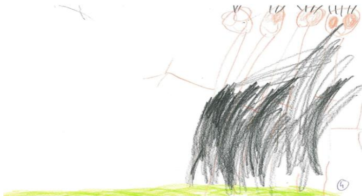
Rysunek 3. Praca plastyczna dziecka (chłopca), lat 4. Źródło: Badania własne.

u dziecka lub sygnalizować napięcie. Z kolei słabszy nacisk kredki i mniej widoczne linie mogą wiązać się z lękiem i wycofaniem (Szabelska, 2011). Na tłumienie bądź wyparcie problemów może także wskazywać występowanie stosunkowo dużej białej przestrzeni po drugiej stronie kartki (Braun-Gałkowska, 1985).